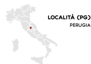
LOCALITÀ (PG) PERUGIA

The centre covers a surface area of 13,800 m 2 and is equipped with a large, 1,700-space car park that provides convenient access through two entrances. Inside the centre, there are 24 prestige brand stores, a 5,000 m 2 Emisfero hypermarket, bars and amenities. Entertainment and kids' activities complete the mall's range of services that meets the needs of the entire family.