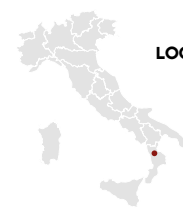
LOCALITÀ (CS) SAN MARCO ARGENTARIO